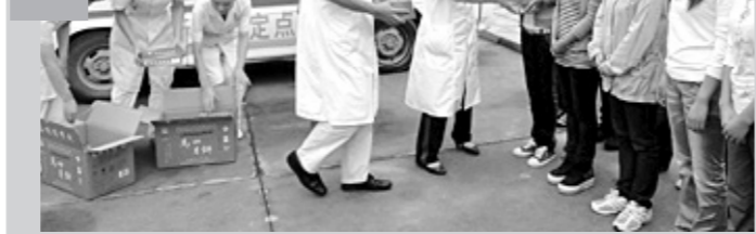
9月8日,周口博爱医院的医护人员来到周口市第四幼儿园,慰问了这里的教师,送去了月饼、生活用品等。